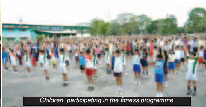
Children participating in the fitness programme