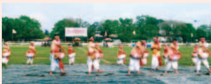
PSPBফুটবল টুৰ্ণামেণ্টৰ আৰম্ভণি অনুষ্ঠানৰ সাংস্কৃতিক কাৰ্যক্ৰম

২০ মাৰ্চ, ২০১১ - PSPBফুটবল টুৰ্ণামেণ্টৰ আৰম্ভণি অনুষ্ঠানৰ সাংস্কৃতিক কাৰ্যক্ৰমত দুলীয়াজান ক্লাব মিউজিক একাডেমী দলৰ অংশগ্ৰহণ।