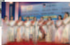
Page - 11