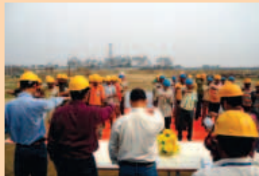
Workers taking safety pledge

one Field Gathering Station (FGS) at Chabua. M/s KPTL, Mumbai has been given the responsibility for Engineering and Design, Procurement & Construct (EPC) both the installations. To commemorate the occasion, a meeting on safety was held at the construction site. Further, safety quiz amongst the workers, best speakers on safety issues and competition to determine best three knowledgeable persons on use of safety appliances etc. are held and rewarded. Several speakers from M/s KPTL, M/s STEP & OIL spoke on their rich experience on importance of the safety measures in a construction site.