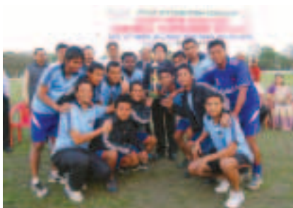
WINNERS - OIL 'A' Team