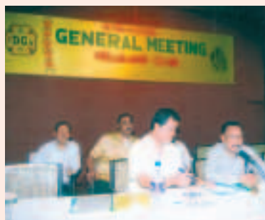
দুলীয়াজান ক্লাবৰ বাৰ্ষিক সাধাৰণ সভা