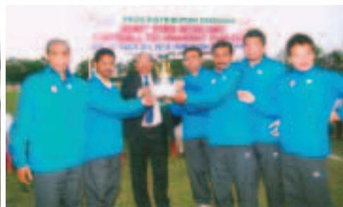
RUNNER - ONGCL Team