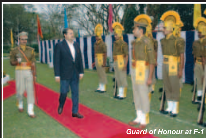
Guard of Honour at F-1