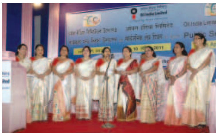
Welcome song by members of WIPS