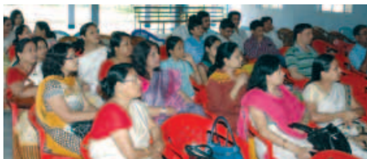
A section of audience