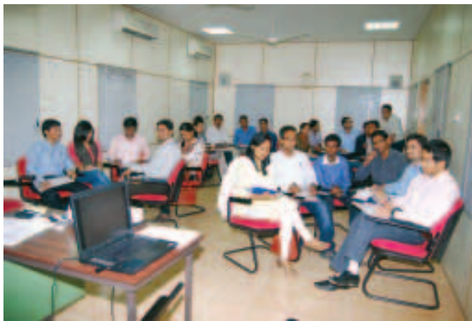
Executive Trainees undergoing FOL program

The Break-through Performance (BP) Team, in its constant efforts to move people towards new, more innovative ways of working covered another sphere when the 112 th and 113 th Foundations for Organisational Learning (FOL) Program was successfully conducted for newly joined Executives. The Program was attended by 41 executives in two batches (21 & 20 each) held from 19 to 21 April and 26 to 28 April 2011 respectively.