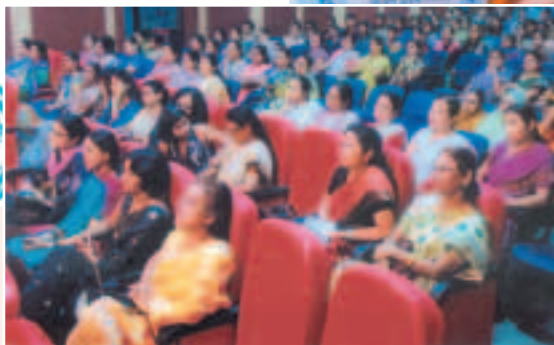
আগ্ৰহী মহিলা গ্ৰোতা / দৰ্শক

আছিল ক্ৰমাগত বৃদ্ধি পাই অহা পানীৰ অভাৱ, পানীৰ অপব্যয়ৰ বিষয় পৰিণতি আৰু পানীৰ যথাযথ ব্যৱহাৰ সম্পৰ্কে জনসাধাৰণক সজাগ কৰি তোলা। প্ৰাকৃতিক আৰু শক্তি সম্পদৰ সংৰক্ষণ তথা পৰিবেশক সুৰক্ষা প্ৰদানৰ দিশত অইল ইণ্ডিয়া লিমিটেডৰ প্ৰচেষ্টা সৰ্বজনবিদিত আৰু এনেধৰণৰ প্ৰচেষ্টাৰ কাৰণে কোম্পানীটোৱে ৰাষ্ট্ৰীয় - আন্তঃৰাষ্ট্ৰীয় স্তৰত বহুতো সন্মান আৰু স্বীকৃতি লাভ কৰি আহিছে।