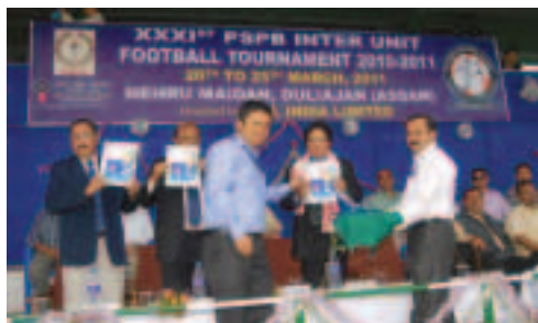
RCE and other dignitaries releasing the Souvenir