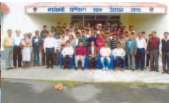
Training Program for Tanker / HMV / Bowser / Driver / Helpers of Contractor Vehicles of LPG Department by DTO, Dibrugarh on 13th March 2011.