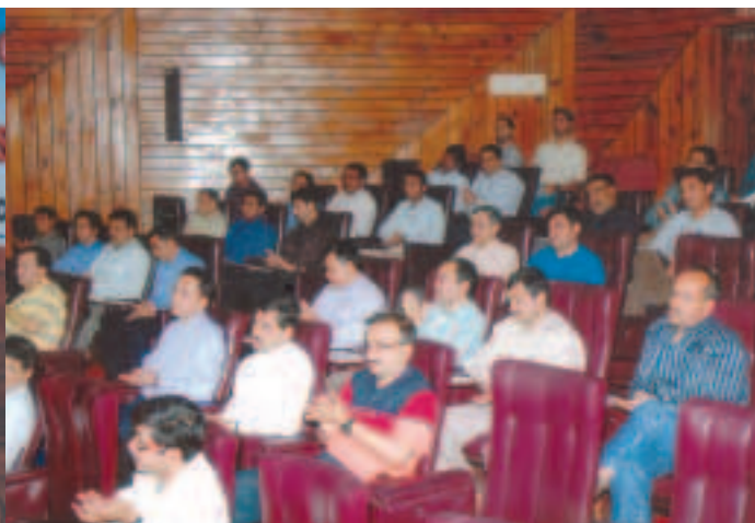
Two days HSE training programme was held in MTDC on 15th & 16th March 2011 for Installation Managers, Mine Safety Officers, Department Safety Officers and Other Mine Officials Drilling, Production Oil, Production Gas, Pipe Line, Rajasthan Project etc.