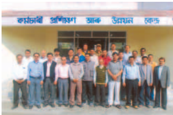
Training for IOWU councillors by Manab Vikash Kendra, Tinsukia on 28 th Feb., 2011 to 2 nd March, 2011 at ETDC.