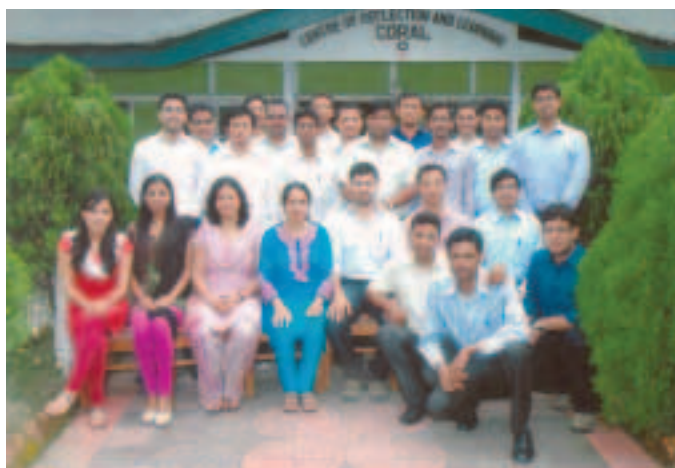
Some Executive Trainees posing for a photograph with BP Coaches

In response to the completion of the program, the participants conveyed their sincere thanks to the BP Team for organising the program. They appreciated the key learnings that would help them gain an understanding of the characteristics of learning organisations and how these ideas can be implemented. The participants acknowledged the fact that the program helped them in acquiring new tools for thinking and interacting around complex issues as well as improve the quality of reasoning. The young executives accepted the team learning skills that