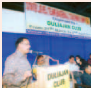
বেচবল প্ৰশিক্ষণ শিবিৰৰ আৰম্ভণি