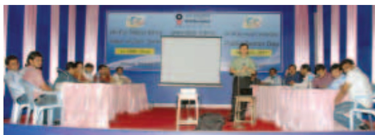
Popular quizmaster Wonkyo Weingken Quizzing the participants