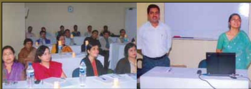
Training on 'Gender Budgeting' by ASCI, Hyderabad from 24-25 November, 2010 at MTDC, Duliajan