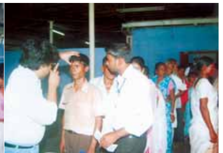
দুৰ্লীয়াজান লায়নচ্ ক্লাবৰ উদ্যোগত চকু চিকিৎসা শিবিৰ