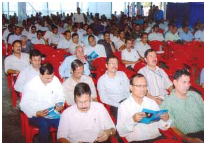
Shareholders attending the 51st Annual General Meeting