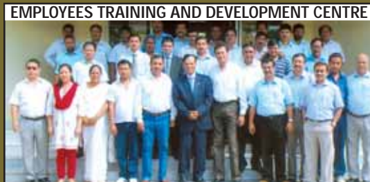
Workshop on preparing Trade Unions for bigger role in organisation building by AMITY Institute of T&D at ETDC from 18-20 August, 2010