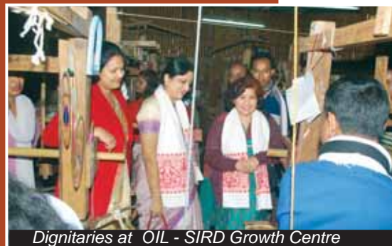
Dignitaries at OIL - SIRD Growth Centre