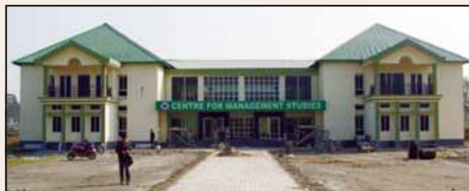
CMS Building at Dibrugarh University