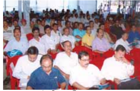
উপস্থিত অংশীদাৰৰ একাংশ

এই প্ৰসংগত শ্ৰীবৰাই জানিবলৈ দিয়ে যে অইল ইণ্ডিয়াই CBMৰ