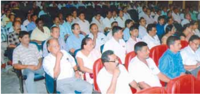
সপৰিবাবে কৰ্মচাৰী সকলে অনুষ্ঠানত ভাগ লৈছে

পাৰে। এজন কৰ্মীৰ সুৰক্ষা আৰু সুস্বাস্থ্য প্ৰতিষ্ঠানৰ কাৰণে যিমান প্ৰয়োজনীয়, নিজৰ জীৱন আৰু পৰিয়ালৰ নিৰাপত্তাৰ কাৰণে তাতকৈ হাজাৰ গুণে প্ৰয়োজনীয়। এইদিশত আমাৰ কোম্পানী সদা সচেতন আৰু সেইবাবেই