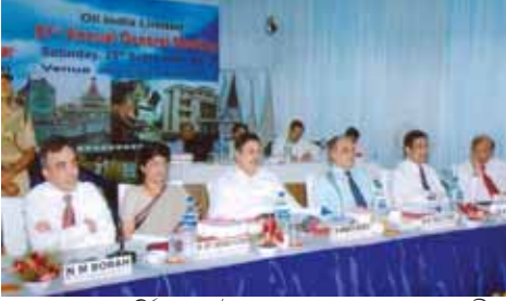
৫১তম বাৰ্ষিক সভা উপলক্ষে মঞ্চত সঞ্চালক মণ্ডলী

২০০৯-১০ বৰ্ষত প্ৰমাণিত আৰু সম্ভাৱনীয় তেল-গেছৰ ভাণ্ডাৰ আৰু উৎপাদনৰ ফালৰ পৰা দেশৰ দ্বিতীয় তৈল প্ৰতিষ্ঠান ৰূপে স্বীকৃত অইল ইণ্ডিয়া লিমিটেডৰ ৫১তম বাৰ্ষিক সাধাৰণ সভাখন ২৫ চেপ্তেম্বৰ তাৰিখে কোম্পানীৰ ক্ষেত্ৰ মুখ্যালয় দুলীয়াজানত অনুষ্ঠিত হৈ যায়।