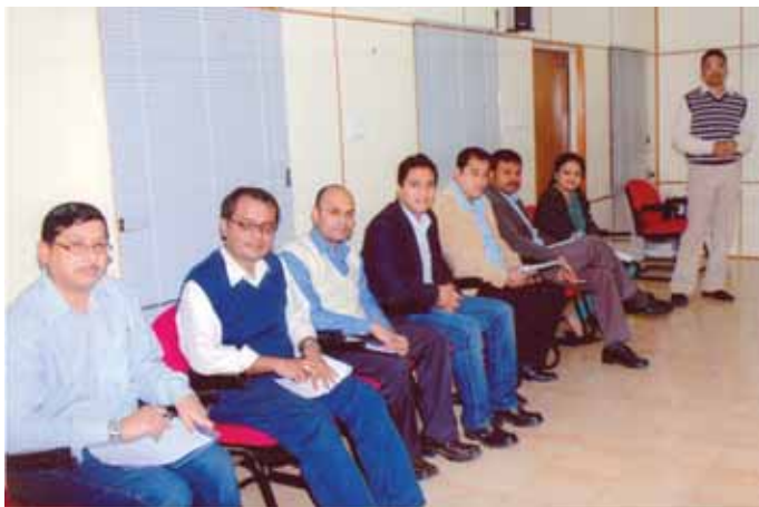
Participants during the session