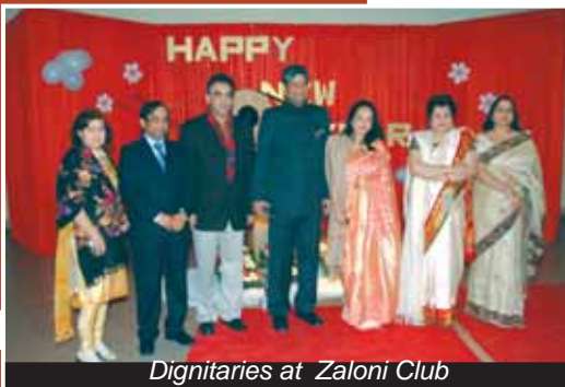
Dignitaries at Zaloni Club