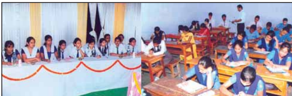
Students taking part in the Debate and Essay Competition