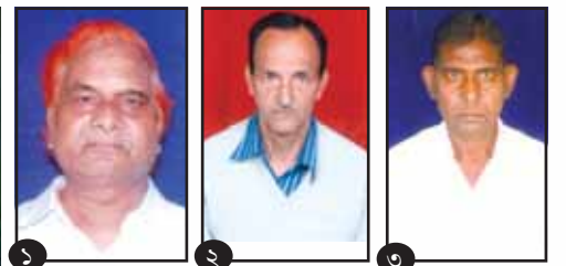
চিকিৎসা (ছেনিটেশ্যন বিভাগ)