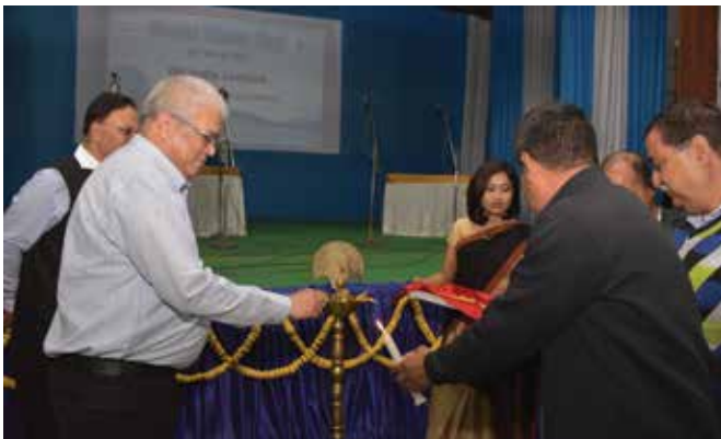
Ceremonial Lighting of Lamp