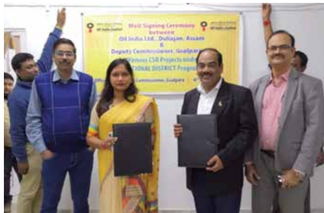
MoU Signing at Goalpara