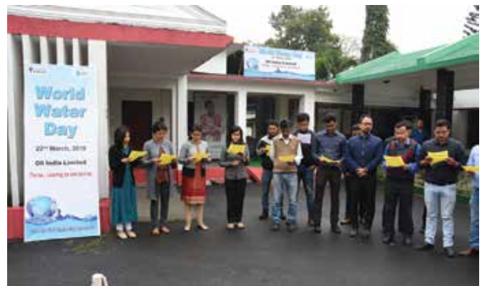
Pledge Taking on 'Water Conservation'