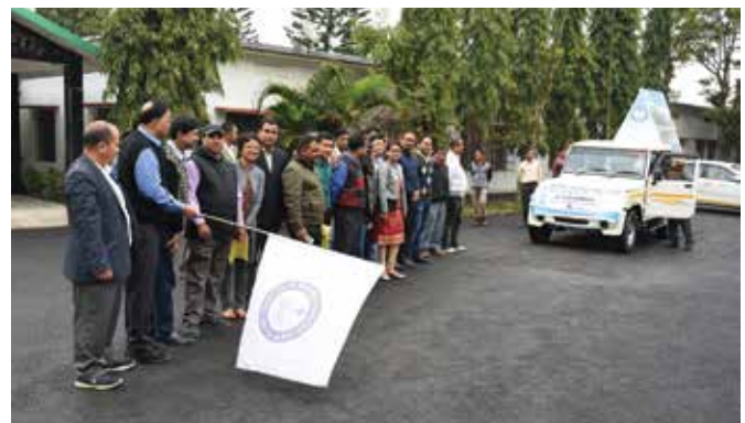
Flag Off of Save water Campaign (Stop the drop)