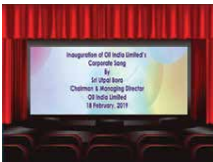
Inauguration of OIL Corporate Song by Shri Utpal Bora, CMD, OIL