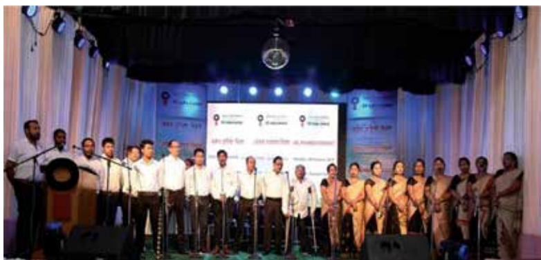
Chorus song performed by OIL Employees