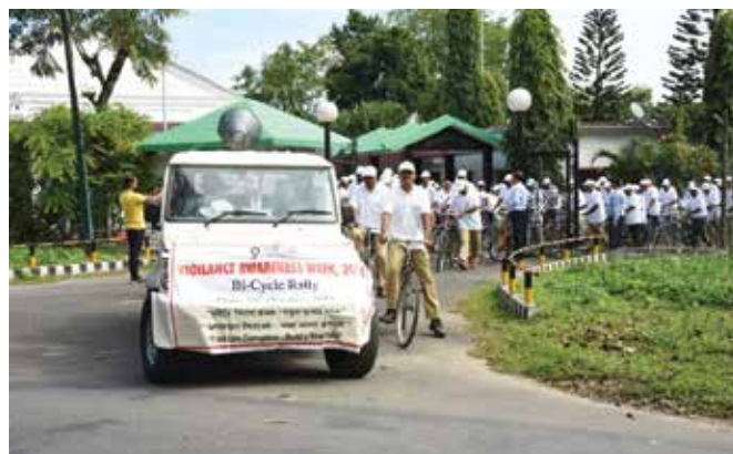
Cycle Rally organised at FHQ, Duliajan

Other activities conducted within the organisation included awareness programs such as Training, Seminar, Workshops; competitions like Quiz, Debate, Essay writing competition, slogan writing competition, painting/drawing/poster making competition etc. To commemorate the occasion of VAW-2018, a Special issue of Vigilance in-house journal "InTouch" was published and the same was released by OIL's Board of Directors.