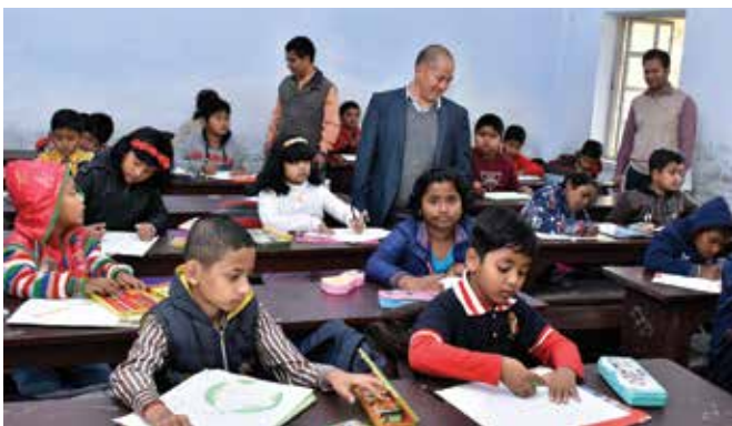
Drawing Competition among children on 'Water Conservation'