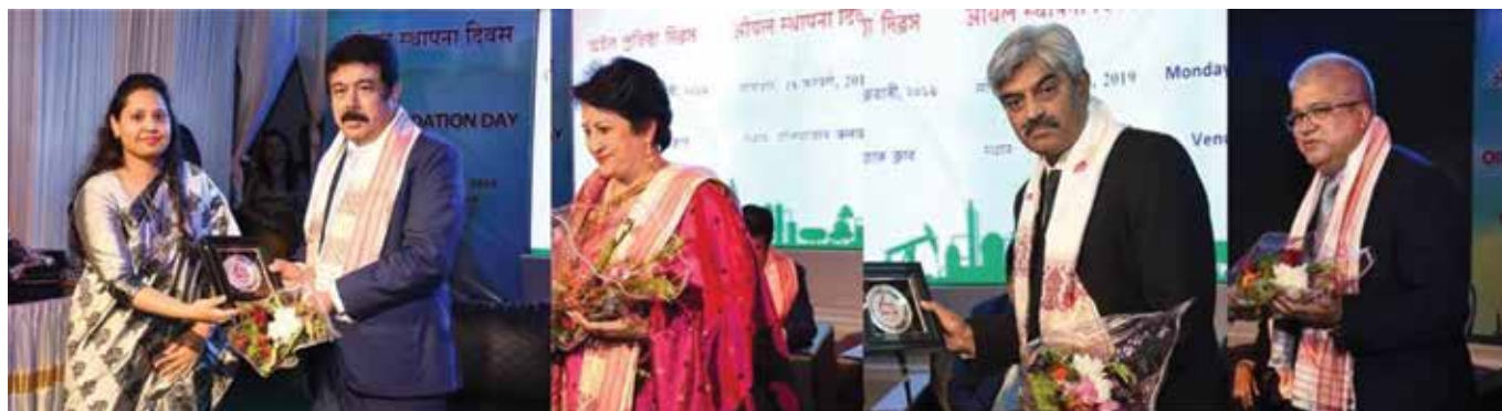
Felicitation of Chief Guest and Guest of Honour

OIL has provided four hundred saplings of different species applicable to NE Region with maintenance cost for one year for this event.