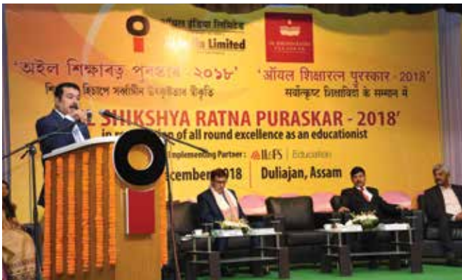
Shri Utpal Bora, CMD, OIL addressing the audience

Oil India Ltd. under its educational CSR initiative has been awarding "OIL Shikshya Ratna Puraskar" honoring the exemplary service of In-service teachers of all provincialized schools (Elementary to Secondary) of Government of Assam and all affiliated non-technical undergraduate colleges under state universities of Assam since 2013. It may be noted that the names of the recipients of OIL Shikshya Ratna Puraskar 2018 were announced through press advertisement on Teachers' Day, 5th September, 2018.