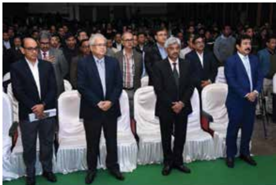
Shradddhanjali in memory of the CRPF personnel