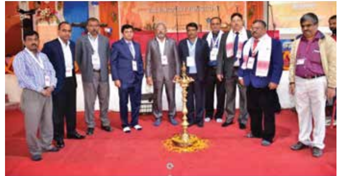
Lighting of the ceremonial lamp