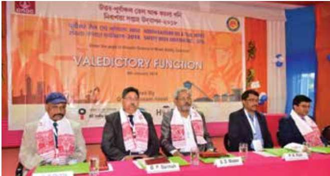
Dignitaries during the prize distribution function

During the function, winners of various intra-organisation competitions like Best Installation under various categories, Longest Accident-free Workmen and Safety Song, Skit, Poster, Slogan were awarded.