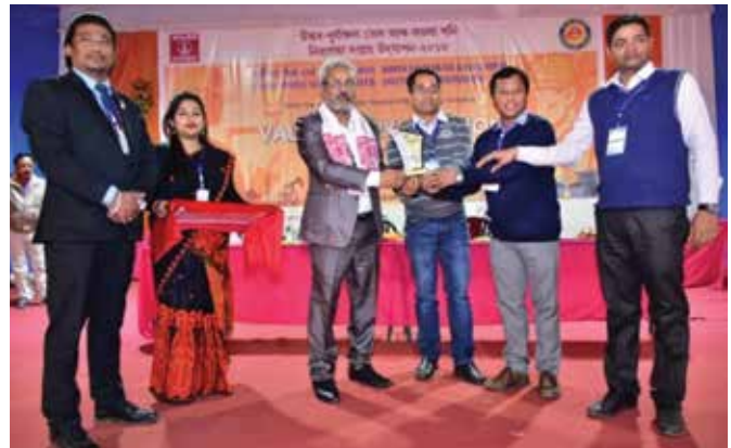
Prize being given away during the event