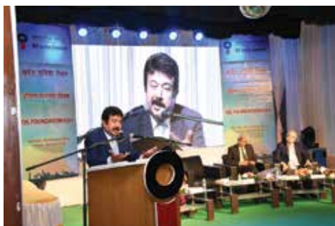
Address by Shri Utpal Bora, CMD, OIL