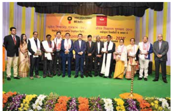
Recipients of OIL Shikshya Ratna Puraskar 2018 with the dignitaries