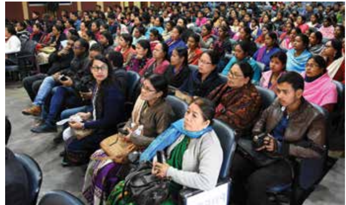
Audience attending the event at Duliujan Club