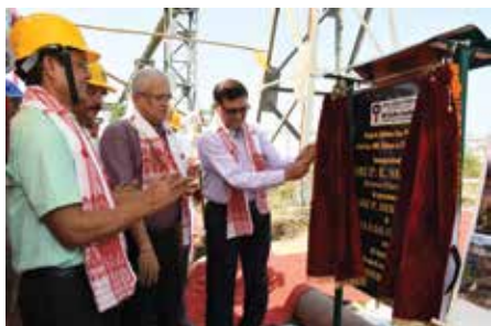
Ceremonious inauguration of the pipeline at Madhuban

areas, the 400 mm Gas pipeline was conceptualised for transportation of rich gas from Loc.HNE, Makum to CGGS, Madhuban. The pipeline is connected to the existing 250 mm NB Gas pipeline from Barekuri to Loc. HNE, Makum at source and CGGS, Madhuban at the receiving terminal. The designed capacity of the pipeline is 1.5 MMSCMD. The pipeline is laid down in the OIL's existing 18-meter row.