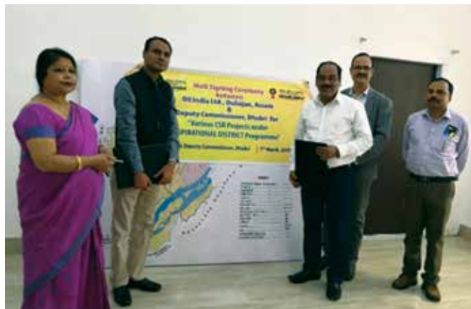
MoU Signing at Dhubri