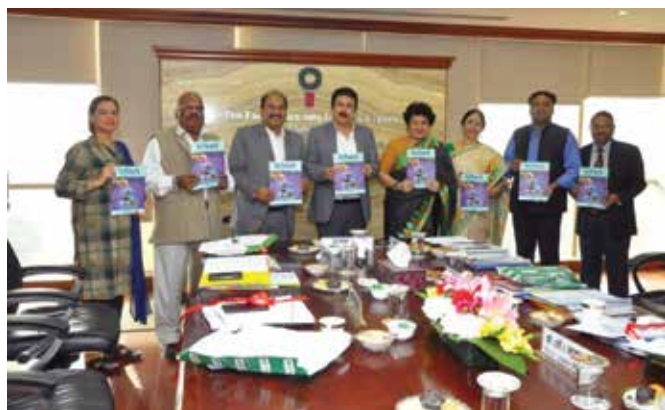
OIL's Board of Directors releasing "InTouch", Special Issue-2018

The week kick started with an Integrity Pledge on 29 th October, 2018, being administered by CMD, OIL and Director (HR&BD) at Corporate Office, NOIDA and by the respective Administrative Heads at other work spheres / installations. Various activities both within and outside the organisation were conducted as an endeavour to elicit wider participation of Oil Indians and general public at large towards eradicating corruption and