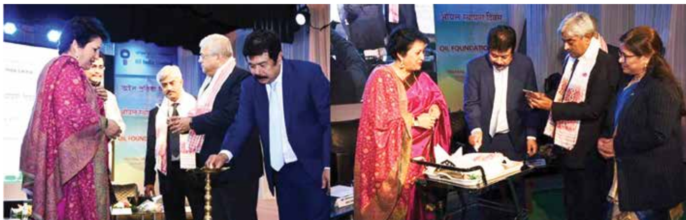
Ceremonious Lighting of Lamp and Cake Cutting