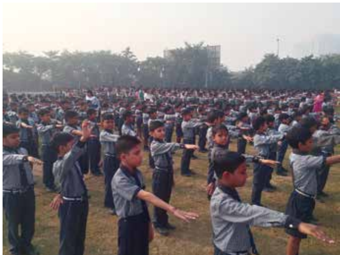
Integrity Pledge being taken by school students, committing themselves to highest standards of honesty and integrity

Public participation plays a vital role in the fight against corruption. With a view to create greater awareness amongst the general public, a gamut of outreach activities centered on the VAW-2018 theme were organized which include awareness campaigns, Poster & Cartoon Making Competition, Slogan Writing Competition, on the Spot Painting competition, Essay Writing Competition, Debate Competition in schools and colleges; awareness Gram Sabhas in rural and semi-urban areas etc. ensuring participation at the grass roots.