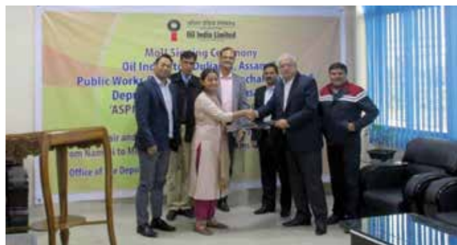
MoU Signing at Namsai