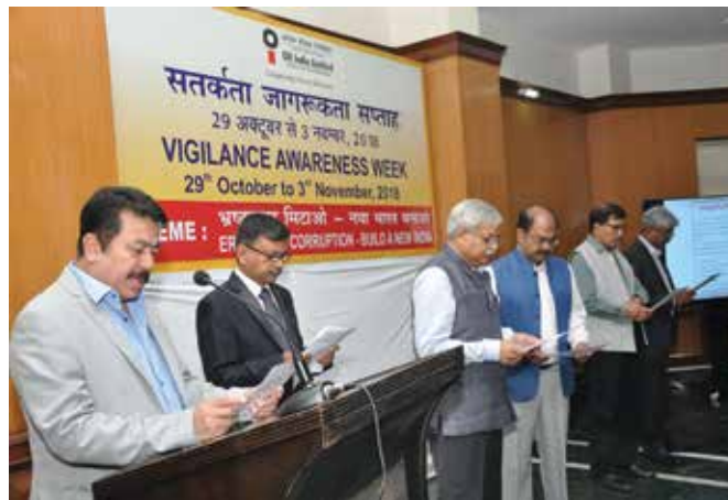
Integrity Pledge being administered by CMD, OIL at Corporate Office, Noida on 29th Oct, 2018 building a "NEW INDIA" .

During the week E-Pledge counters were set up in prominent places in Duliajan and Noida for facilitating e-pledge by Oil Indians, their family members, Vendors/contractors/ stakeholders etc. 2378 nos. of Oil Indians including vendors, contractors etc. took online E-pledge as responsible citizens of India at OIL facilitated counters. Cycle Rally, padayatra (procession) with chanting of anti-corruption slogans were organised at Duliajan and Guwahati. Street Plays were also conducted in densely populated public places in Guwahati and Jodhpur. Through this play message against corruption and its ill effects were delivered to the masses.