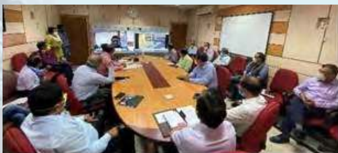
OIL uses Online Communication Tools to ensure Social Distancing norms at FHQ