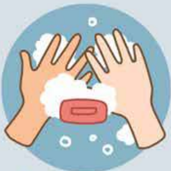
Soap & Water