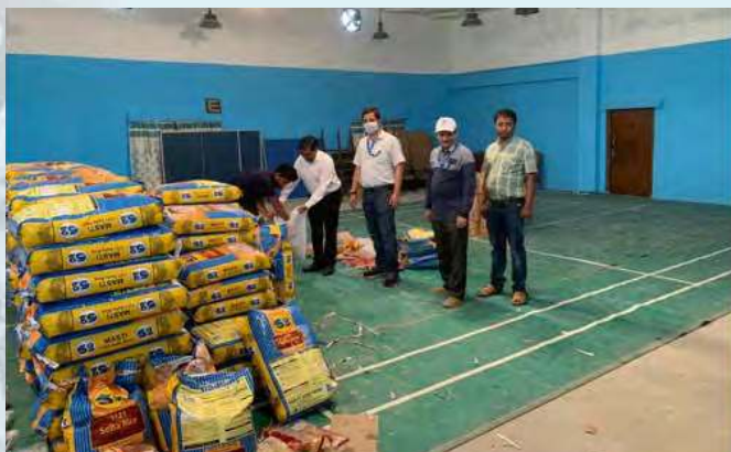
OIEEA, FHQ distributes Food Packets to the needy people in OIL's operational areas