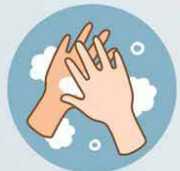
Back of hands