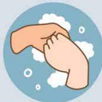
Back of fingers