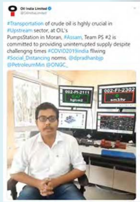
Pump Stations worked round the clock during the lockdown