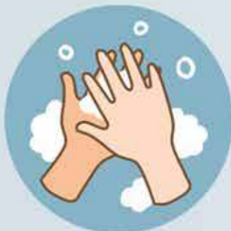
Palm to palm