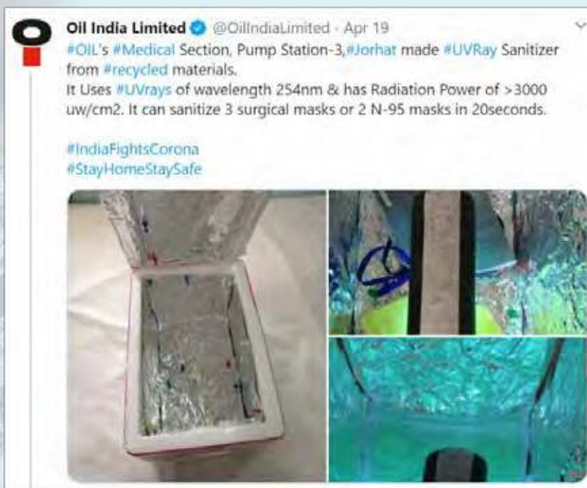
PS-3, Jorhat makes UVRay sanitizer from recycled materials.