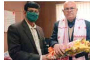
স্বৰ্গীয় সত্য ব্ৰতিকাৰ ৰসায়ন বিভাগ