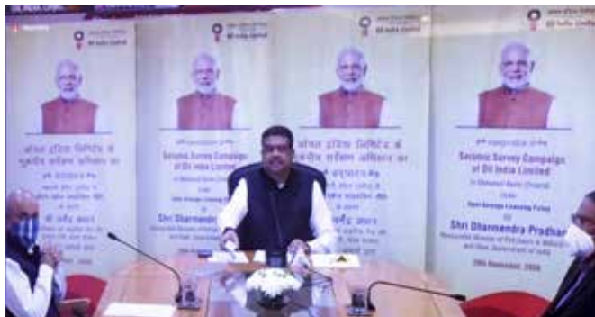
Shri Dharmendra Pradhan, Hon'ble Minister for Petroleum & Natural Gas and Steel along with Shri Tarun Kapoor, Secretary, MoPNG and Shri Amar Nath, JS(E), MoPNG.

3D seismic survey and 73 exploratory wells are planned in these 25 blocks. The envisaged investment is to the tune of Rs. 5400 crores over the next three to four years. Apart from consolidating its position in northeast and Rajasthan, OIL has made conscious efforts to carry out exploration in Category II & III sedimentary basins in line with Government of India's thrust for exploration.