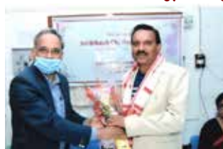
শ্ৰীযুত বি. চি. দে' কূপ সংলগ্ন বিভাগ