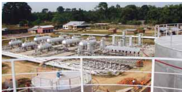
A bird's eye view of newly commissioned Bhogpara OCS

was a mixed platter of external adversities and prolonged litigation matters. Nonetheless, the entire Project team never lost its focus. What it needed was meticulous planning & organizing, controlling situations, motivating employees, adapting to change and delivering results. The credit of Completion of Bhogpara OCS Project undoubtedly goes to the entire team members who were involved from time to time.