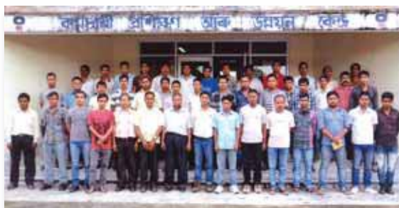
MVT Program for Contractors' Personnels by Internal Faculty from 8 th to 13 th July 2013 at ETDC