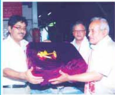
শ্রী বিদ্যা হাজৰিকা পৰিবহন বিভাগ