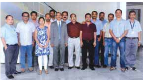
Training Programme on Managing Outsourcing and Contract Labour on 30 th & 31 st May 2013 conducted by XLRI, Jamshedpur for executives