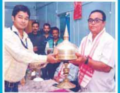
শ্রী নীৰেণ শইকীয়া উৎপাদন (গেছ) বিভাগ