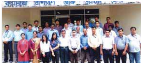
Keep in Touch programme on 28 th June 2013 by Internal Trainees for Executives