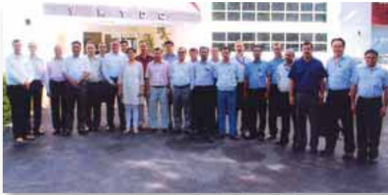
Training Programme on Project Management from 24 th to 28 th June 2013 conducted by Institute of Public Enterprise, Hyderabad for Executives (Grade D & above)