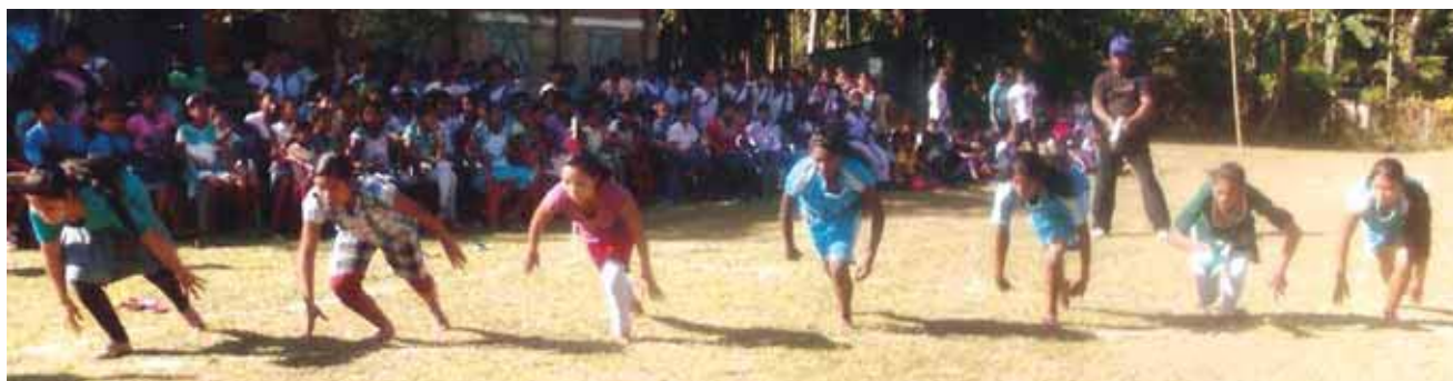
Rural Sports at Baghjan