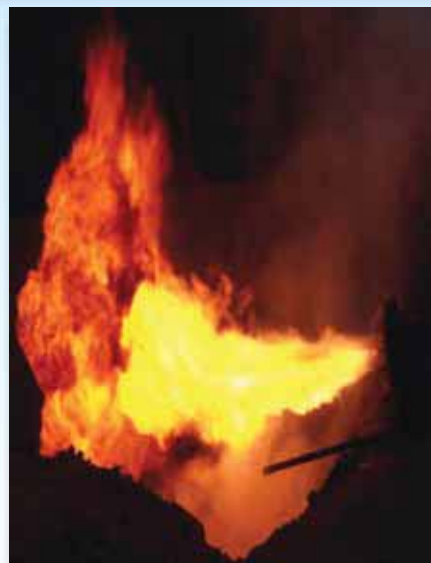
Burning oil in the flare pit during production testing

OIL recorded discovery of Hydrocarbon in the third well (Lassa#1) at Gabon on 22 nd July 2013. This is the first ever discovery by OIL in an overseas project as an operator. As per the reports, the well recorded a flow of Crude oil (approx 37.7 API) @ 220-225 bbl per day (BS&W 2%) and Natural Gas at 3000-4330 SCUMD.