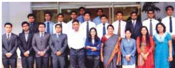
Training Programme on Corporate Grooming and Etiquette conducted by Panache Studio, Mumbai for ETs and Grade B officers on 18 th & 19 th June 2013