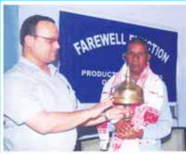
শ্রী বাম সমুজ হৰিজন জি চি এছ - ৫