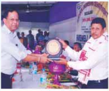
শ্রী এছ চি চেতিয়া বিদ্যা বিভাগ