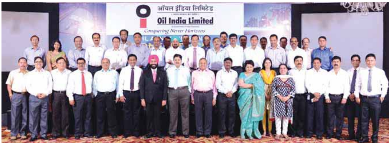
Participants of HR Conference 2013 posing for a group photograph