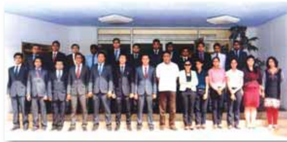
Training Programme on Corporate Grooming and Etiquette conducted by Panache Studio, Mumbai for ETs and Grade B officers on 20 th & 21 st June 2013