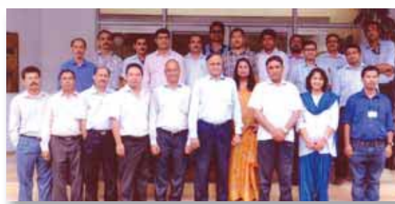
Training on Project Management from 8 th to 12 th July 2013 organised by Institute of Public Enterprise, Hyderabad for executives of Grade D & above