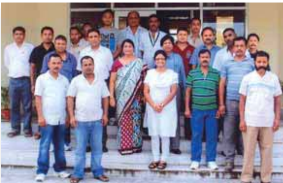
'Pragati Path' a soft skill Training Programme for Grade I to IV employee by HRDC, New Delhi from 24 th to 27 th June 2013 at ETDC