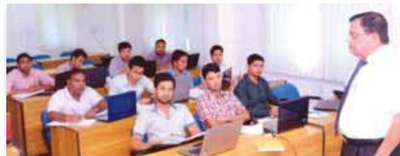
Training on Six Sigma Green Belt Certification from 1 st to 4 th July 2013 organised by Benchmark Six Sigma Pvt Ltd, Noida