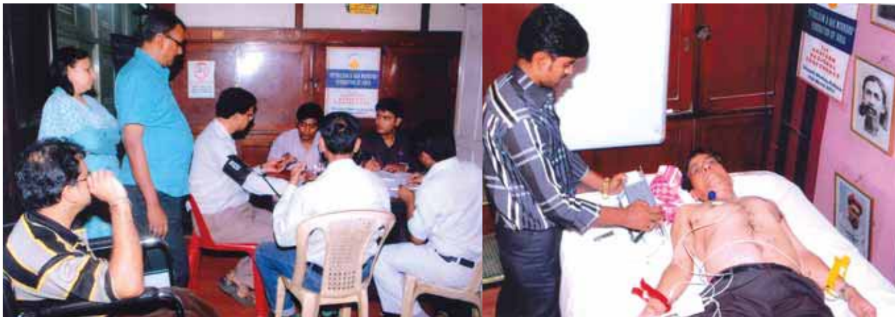
On 5 th June, 2013, OIL Calcutta Office organised 'Health Awareness Programme' conducted by Desun Hospital & Heart Institute, Kolkata in the Office premises. All the Executives & Employees of Calcutta Office participated in the programme enthusiastically.