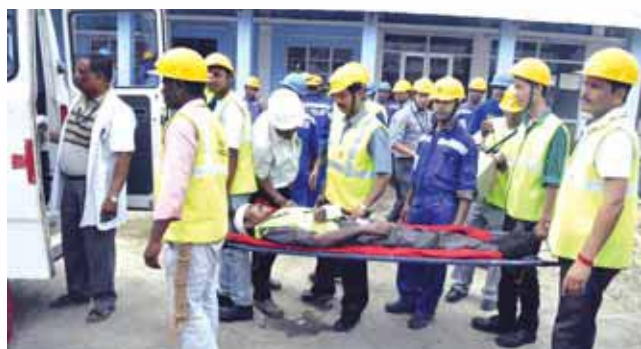
Injured person taken to the nearest Hospital

The offsite mock drill was concluded successfully with the debriefing session.