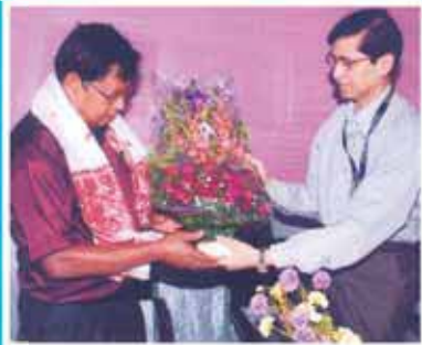
শ্রী লক্ষী দিহিঙীয়া বসায়ন বিভাগ