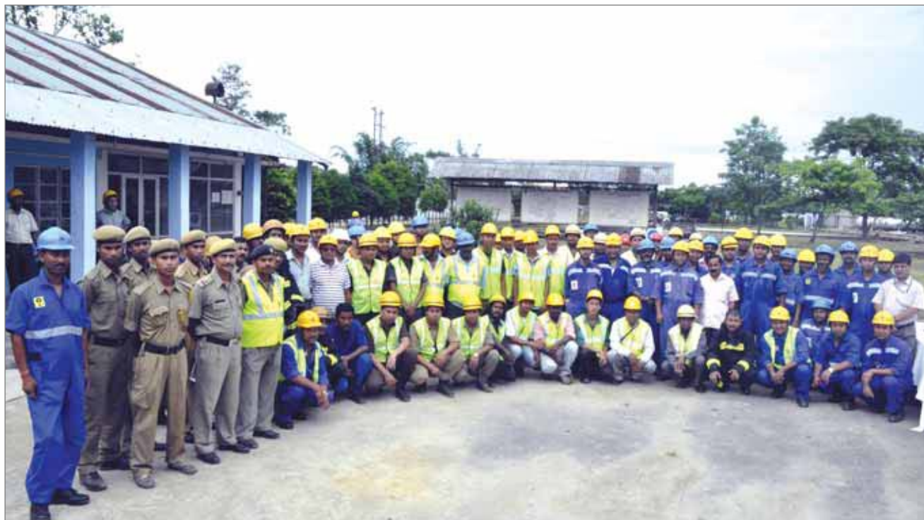
Representatives of OIL and participating industries posing for a group photograph after the mock drill