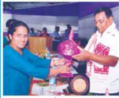
মহঃ এইচ বহমান বিদ্যা বিভাগ