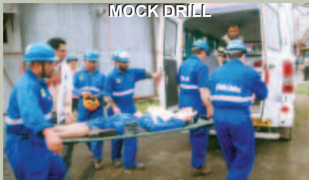
Fire Mock Drill at Duliajan power station of Electrical Department on 17.02.2011