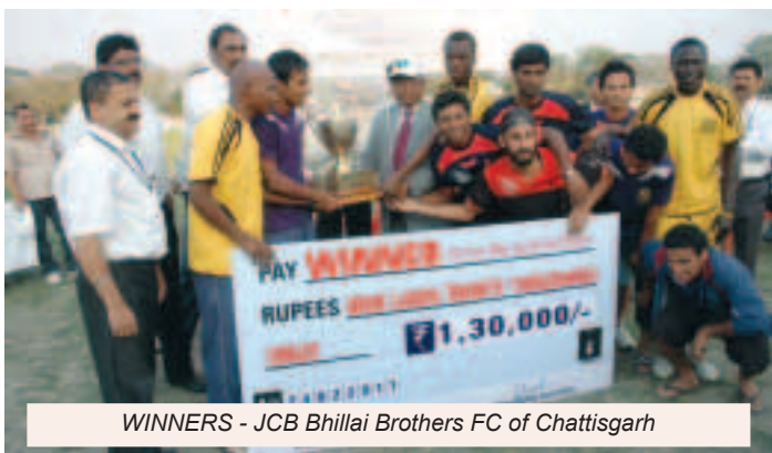
WINNERS - JCB Bhillai Brothers FC of Chattisgarh