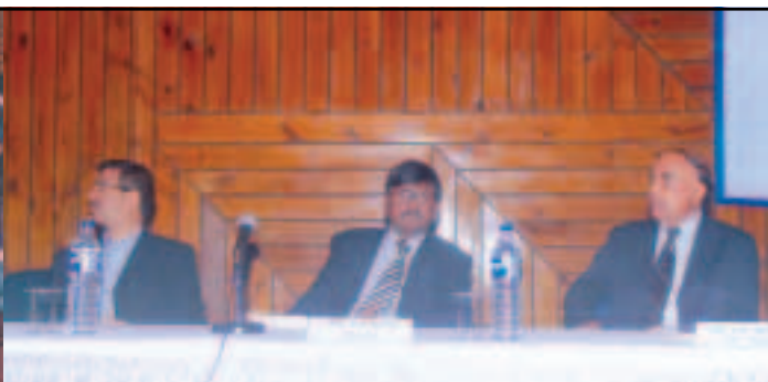
Training Programme on "Drilling Efficiency Optimization" by M/s. India Subcontinent Baker Hughes, Gurgaon from 8th to 10th Feb., 2011.