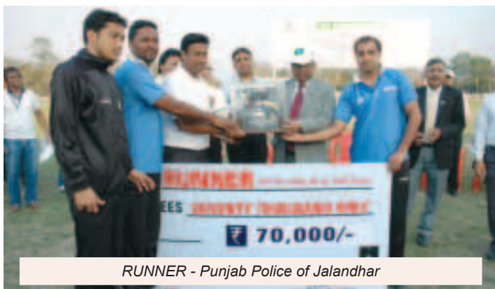
RUNNER - Punjab Police of Jalandhar