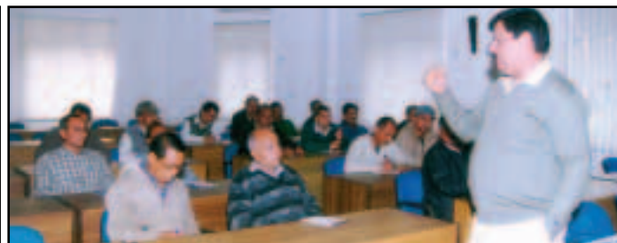
A Training / Interactive Session on Company's Policies & Procedures (5th Batch) on 15th Feb, 2011 at MTDC.