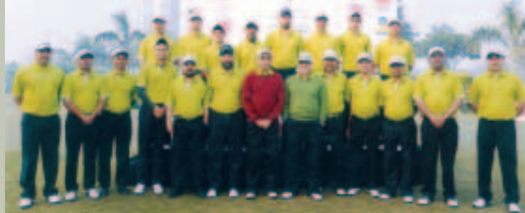
OIL Golf team bagged the championship prize in the 31st PSPB Inter Unit Golf Tournament, 2011. In the photograph, OIL Golf Team seen with Shri NM Borah, CMD, OIL during the inauguration day of the Golf Tournament.