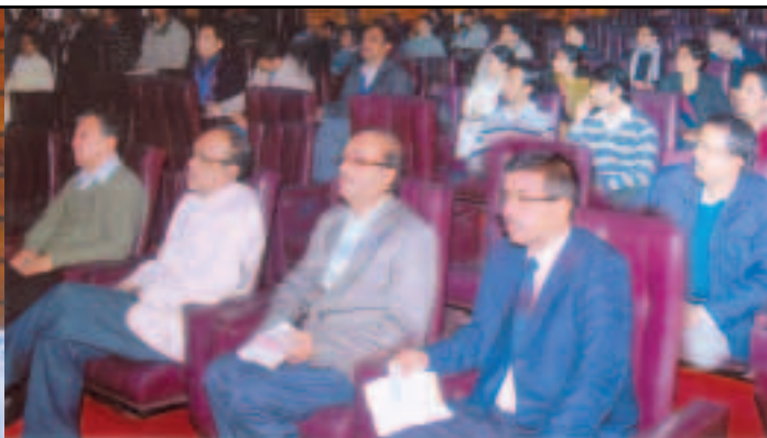
One day awareness programme on Company's policy & procedure on 28th and 31st Jan 2011 at MTDC.