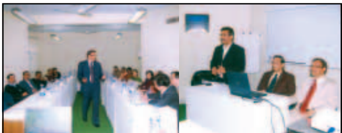
Workshop on "Creativity, Problem Solving & Direction, Foundation for Attitude & Career Empowerment, Delhi on 17th & 18th Feb, 2011 at MTDC