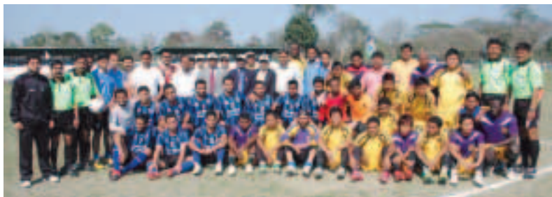
JCB Bhillai Brothers FC and Punjab Police posing for a group photograph

This time a total of 14 teams took part in the championship. The teams that participated include Shillong Lajong F C, Punjab Police (Jalandhar), JCB Bhillai Brothers (Chattisgarh), Techno Aryan Club (Kolkata), Vasco S C (Goa), Assam Police Blues (Guwahati), ASEB FC (Guwahati), Guwahati Town Club, Green Valley SC (Guwahati), NISA FC (Manipur), Nagaland Police (Nagaland), Five Star Southern