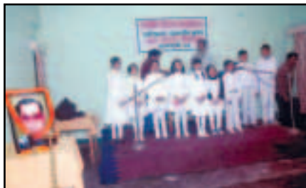
শিল্পী-দিৱসত কণ-কণ শিশুৰ সমবেত সঙ্গীত পৰিৱেশন

“শিল্পী মই তিনিও কালৰ অতীতৰ বৰ্তমানৰ অনাগত ভৱিষ্যৰ.... নানা ভাষা, নানা আশা নানা জাতি-বৰ্ণ জিনি মই শুনো বিগি বিগি বিশ্ব জনতাৰ এক অপূৰ্ব সঙ্গীত....”