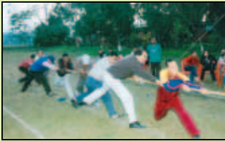
কাৰ কিমান জোৰ - বছৰেকীয়া খেল-খেলা

৯ জানুৱাৰী, ২০১১ দেওবাৰৰ দিনা দিনযোৰা কাৰ্য্যসূচীৰে ৪০ সংখ্যক বছৰেকীয়া