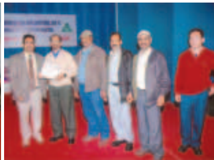
Prize Distribution Ceremony