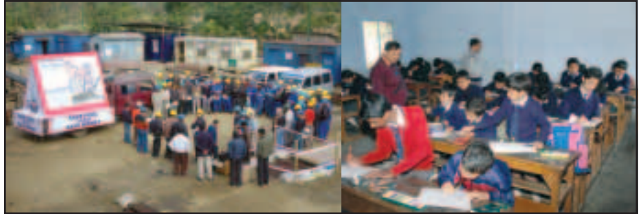
Technical Meet at Drilling Location NKZ during the fortnight Students taking part in the Drawing Competition

On the Concluding day of the Fortnight, valedictory function-cum-prize distribution ceremonies were organised at Duliajan, Moran, Digboi, Noonmati (Guwahati) including all pump stations and at other OIL's spheres Headquarters, where winning participants of various competitions/events were awarded prizes with certificates of proficiency.