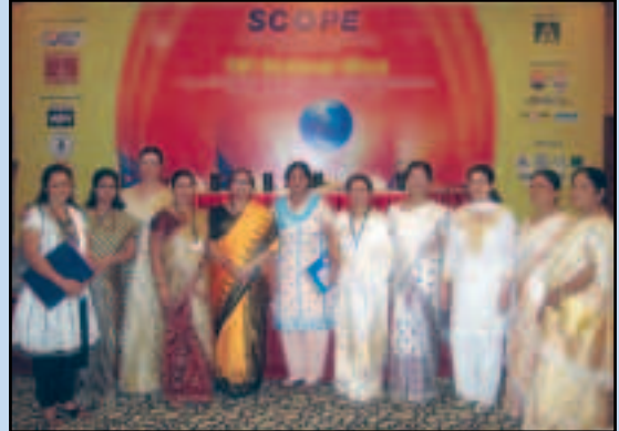
Representatives of WIPS Cell OIL participated in the Meet