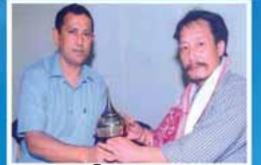
শ্ৰী এম নেমু ৰিগ বিল্ডিং বিভাগ