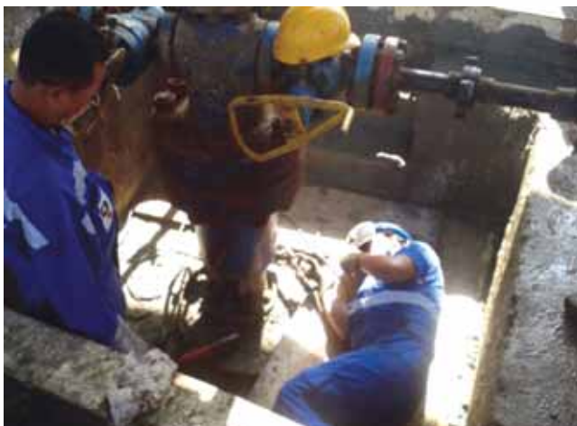
Casing Housing Welding Job in progress

TIG welding for Coil Tubing Unit of Production(OIL): Welding of high pressure handling alloy steel tube of Coiled Tubing Unit (CTU) by Tungsten Inert Gas (TIG) welding technology is one