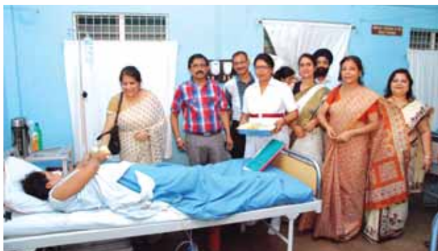
Sweets distributed to patients at OIL hospital