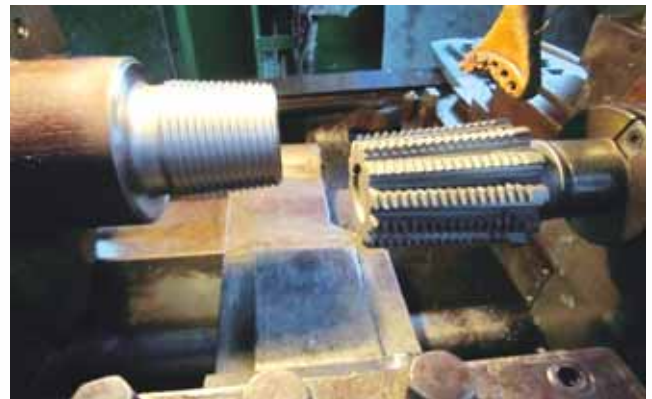
Drill Collar with Stress Relief Groove at Pin end being completed at CWS

Drill Collar Rethreading with Stress Relief Contour conforming to API Specification 7: Various modifications have been incorporated in API standards for better quality & safe operation of Oil Field activities. Stress Relieving Contour is one of them recommended by API. This contour helps in reducing the chance of failure due to the cyclic fatigue inherent in bending. Drill Collars need to be provided with API stress relief groove on the pin and bore back at box which remove unengaged threads in highly stressed areas of the drill collar joint. This leads to fewer failures as bending occurs in the smooth surfaces, which are free from stress concentrations. On request from Drilling Department, CWS team took up the challenge, thoroughly studied details of the API recommendations and successfully completed the job which was later certified by M/s Oil Country Tubulars Limited, Hyderabad (third party) as acceptable for drilling as per international norms.