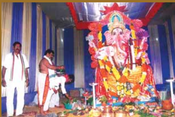
তৈল চহৰ দুলীয়াজানত গণপতি আৰাধনা

(নিঃস্বার্থভাৱে মানৱ সেৱাত ব্ৰতী হস্পিটেলৰ ডাক্তৰ, নাৰ্চ আৰু তাত কৰ্মৰত ভিন ভিন বিভাগৰ ব্যক্তিসকলৰ প্ৰতি উৎসৰ্গিত)