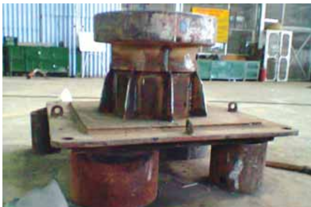
Final Job after Inspection & ready for dispatch

Casing Head Housing Welding: Recently on August 2013, Drilling Department informed CWS about the urgent requirement of welding job to be carried out in the Casing Head Housing as