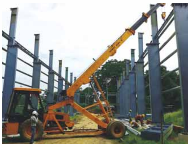
CWS expansion job in progress

In addition, some jobs that are in pipeline are listed below: