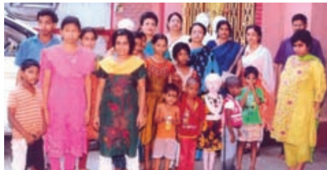
The Metro Ladies Club, OIL Kolkata extended help to the children of blind school under 'Voice of World' by providing clothes and food materials for the children

and differently abled children. The cheque was handed over to 'Voice of World' a social welfare organisation that works for differently abled children by providing free food, shelter and education at Kolkata.