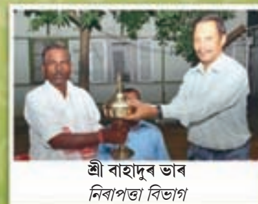
শ্রী বাহাদুৰ ভাৰ নিৰাপত্তা বিভাগ