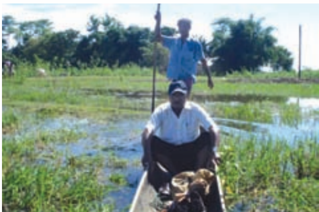
Visit to well site during summer - Lezai area - Loc DRA