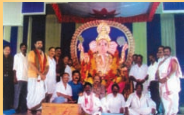
তৈলনগৰী দুৰ্লীয়াজানত গণপতিৰ আৰাধনা