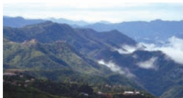
General topography of Mizoram