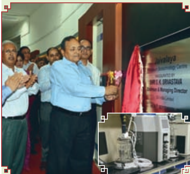
Shri S K Srivastava, CMD, OIL in presence of other Functional Directors of OIL ceremoniously inaugurated 'Jaivalaya' the state-of-the-art Petroleum Biotechnology Centre at Research & Development Department, OIL Duliajan on 26 th September 2015