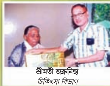
শ্রীমতী জৱনছা চিকিৎসা বিভাগ