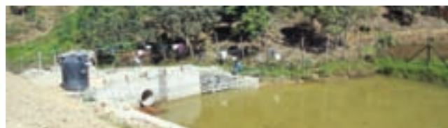
OIL's initiative in Water conservation at Loc 8-Mizoram

and cities and therefore are most affected by all these. There are many instances of kidnapping, intimidation, demand which have taken place in some of the areas. These incidents firstly demoralize the people working in such remote areas away from their families and secondly results in prolong suspension of important work. Further due to limited resource with the local administration as well as for other reasons like logistic & communication problem and environmental problems beyond their control, prompt and strong support from these agencies cannot be always anticipated. Another important factor which also requires consideration is regarding the local tribes residing generations together in the some of the remote areas where exploration activities take place. Generally the tribes are happy in their peaceful and natural surroundings and as such do not welcome anything that might disturb the serenity. Due care and respect for the sentiments and feelings of these tribes is therefore is very important.