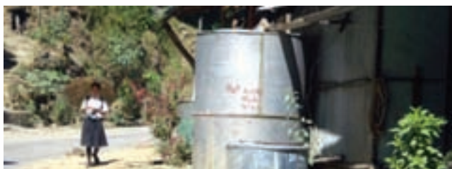
Rain water harvesting is part of life in Mizoram