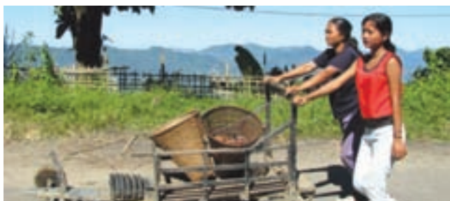
Locally developed hand cart with brake & suspension systems in Mizoram takes care of local transportations