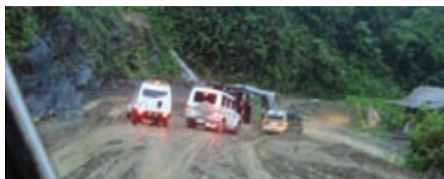
Condition of NH 54 in Mizoram during rain