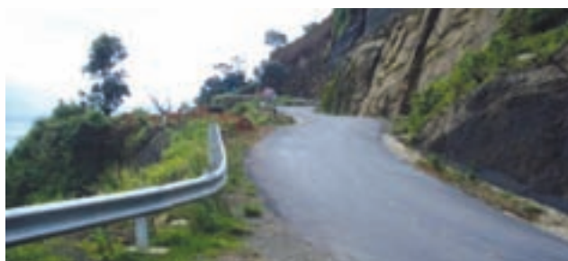
Roads susceptible to land slide

In entire North east India, the rain starts sometime in April and continues till September every year. The working period is therefore from October to April (nearly 6-7 months). As such, while planning any construction work for well site and new roads and subsequent transportation of heavy equipment, especially in hilly areas, one must take the account of the above working window. All the activities right from seismic survey to production testing should be scheduled in such a manner that some of the field works like seismic survey; Geological fields work, topographical survey, construction work and major transportation could be carried out in the months within working window.