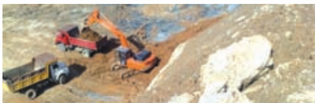
Use of Machinery has become indispensable (Loc MZ-8 in Mizoram)

7.0 Law and order and other Environmental problems: Being economically not developed to the required level, insurgency and other type of law and order problems are very common in North East India. Hydrocarbon Exploration activities carried out in deep jungles and remotest areas away from the town