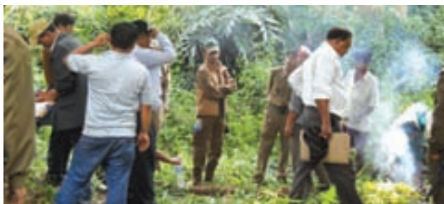
Our people at work - Loc-1 in Dima Hasao - Smoke used to repel mosquitos

winter the silting in the river is so massive and depth becomes so less that it again becomes difficult for ferries to cross with heavy loads. The riverine area of Brahmaputra and other rivers also pose lot of challenges while constructing roads and carrying out hydrocarbon activities.