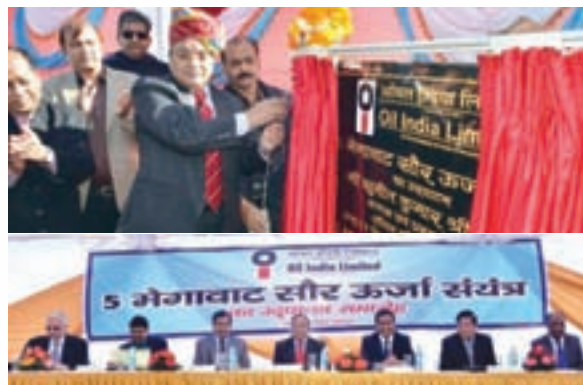
Shri S.K. Srivastava, CMD, OIL, inaugurating the 5 MW Solar Power Plant at Village Raghwa, Ramgarh, Rajasthan

The 5 MW Solar Power Plant consisting of 20408 solar modules each having a capacity of 245 watts, has been contributing towards the growing energy needs of our country since its commissioning. An overhead transmission line of 11.49 Kms has been constructed to feed in the generated power to the DISCOM Grid.