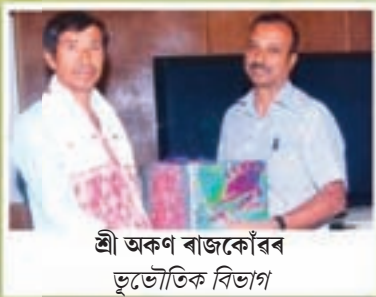
শ্রী অকণ ৰাজকোঁৱৰ ভূভৌতিক বিভাগ