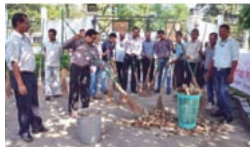
Cleanliness drive at R&D Building premises