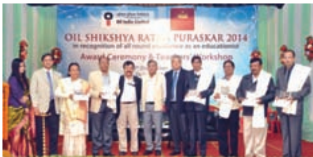
Recipients of OIL Shikshya Ratna Award with the dignitaries