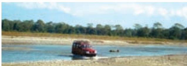
Way of life - Way to Sadiya block during winter

and very risky. People in these areas adopt to the mode of transport which can safely ply in these roads. The first car which landed in Aizawl around 75 years ago was firstly dismantled and transported in parts by boats in which was later on re assembled. In some of the important roads, never a trailer or heavy vehicle with load equivalent to heaviest load in a rig package has ever moved. Similarly in case of Sadiya block, where it is still not possible to reach without either crossing either Lohit River in Arunachal Pradesh or mighty Brahmaputra River in Assam. Infrastructures are not available for ferrying the rig package through these rivers. The basic problem is that during high flood it becomes impossible for the ferries to cross the rivers due to high current and during