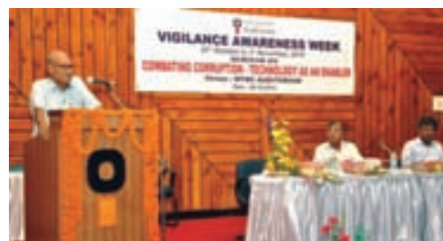
Technical Seminar at MTDC