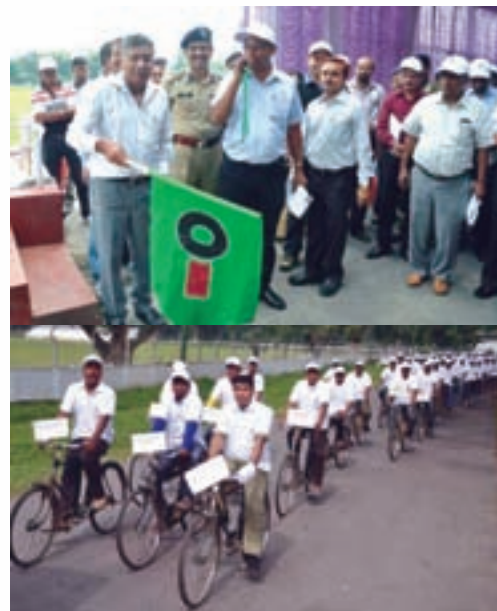
Flagging-off of cycle rally

On the spot Slogan, Cartoon and Painting competitions were also held at OIL Higher Secondary School for school students in and around Duliajan. To create Vigilance Awareness among public, Banners and Posters containing award winning Slogans were displayed in OIL's township and operational areas of Duliajan, Digboi, Moran and Arunachal Pradesh.