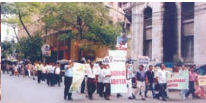
OIL Calcutta Branch organised Swachh Bharat Abhiyan by taking pledge, walkathon and cleanliness drive near its office complex