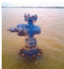
Flood in Lezai area - Loc DRA

4.0 Unfavourable weather and limited working window Weather in the north east India always plays havoc in many ways. It is very general that during the rainy days works are hampered in plain areas due to flood and incessant rain. And in hilly areas the heavy rain results in landslides disrupting the entire road network. Due to the above, the construction work in both in plains and in hills comes to a standstill. In places like Mizoram construction works are normally suspended during the rainy period. The effect of rain continues even after the downpour withdraws. Aftermath the prolonged and heavy rain the massive repair of damaged roads which also requires heavy amount of fund becomes another hurdle to smooth logistic.