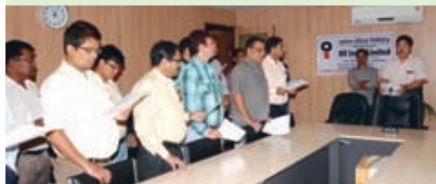
Glimpse of oath taking ceremony during the Vigilance Awareness Week observed at Kakinada Office. Every year the week is observed to create Vigilance Awareness amongst the employees.