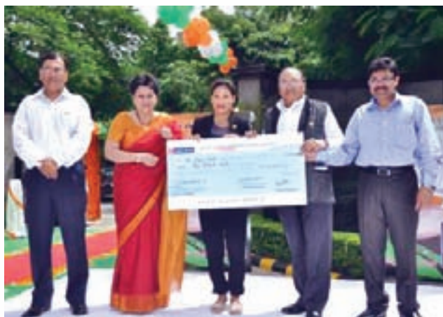
M.C. Mary Kom being felicitated by the Chairman & Managing Director and other Directors and Chief Vigilance Officer of Oil India Limited

Mrs. M.C. Mary Kom in her address to the OIL family expressed her gratitude for honouring her. She spoke at length about how she made it to this stage and the struggles that she had to undergo when she started as a young girl who wanted to pursue boxing in the North Eastern state of Manipur. She called out to all the young girls and women present in the gathering to not be deterred by the commonplace notions of women