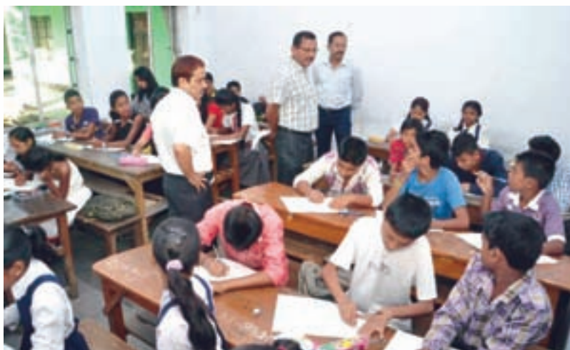
Children during the slogan, cartoon & painting competition