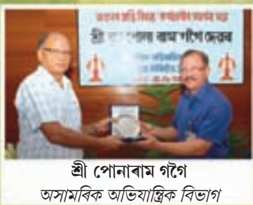
শ্রী পোনাৰাম গগৈ অসামৰিক অভিযান্ত্ৰিক বিভাগ