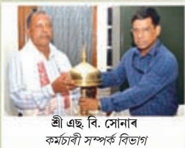
শ্রী এছ. বি. সোনাৰ কৰ্মচাৰী সম্পৰ্ক বিভাগ