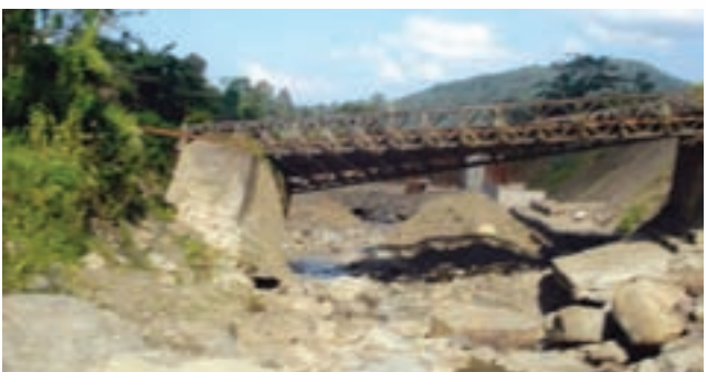
Devastation after rain - Dima Haso