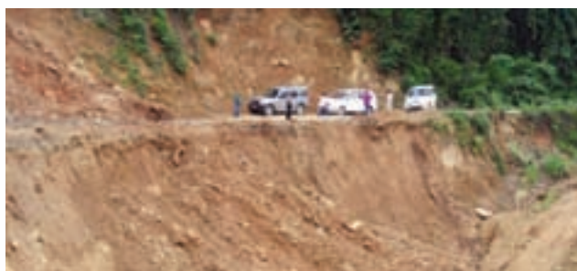
Devastation after rain - Mizoram