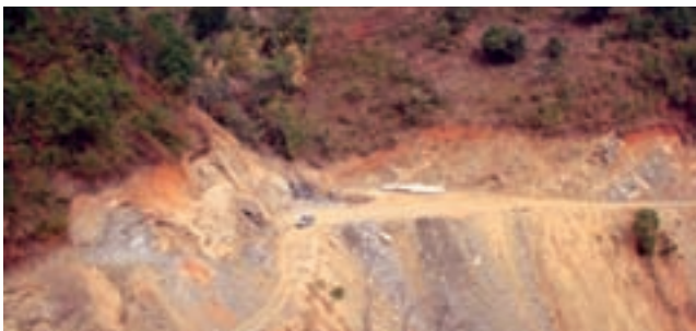
Risky roads - Aizawl Bypass