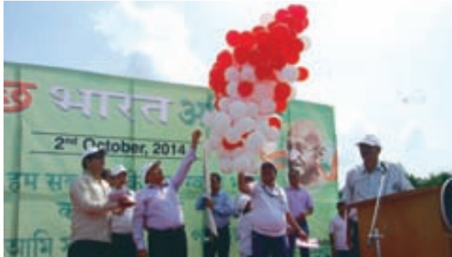
Shri S K Srivastava, CMD, OIL ceremoniously launching Swachh Bharat Abhiyan by releasing balloons at Nehru Maidan

Oil India Limited on 2 nd October 2014 joined the 'Swachh Bharat Abhiyan' launched by the Government of India by organising mass awareness programme at Nehru Maidan Duliajan and by identifying few schools in its operating areas of Dibrugarh and Tinsukia which are without toilets under Swachh Vidyalaya Programme.