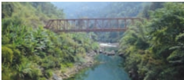
Steel bridge over river Tiawng - Loc Mz-4