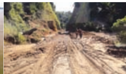
Devastation after rain - Mizoram