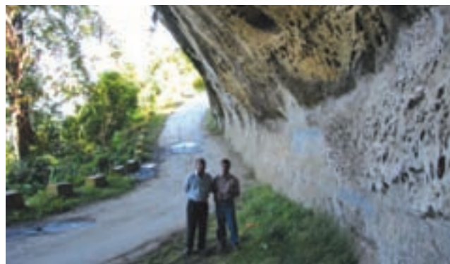
Road cut through protruding rock - Mizoram