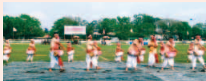
PSPBফুটবল টুৰ্ণামেণ্টৰ আৰম্ভণি অনুষ্ঠানৰ সাংস্কৃতিক কাৰ্যক্ৰম