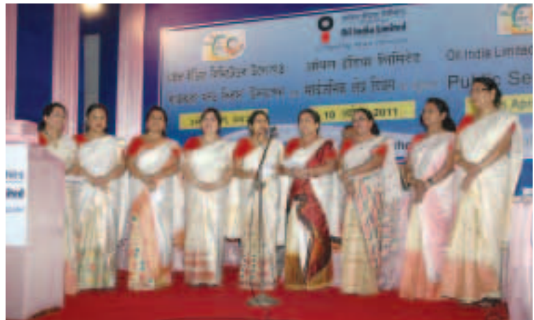
Welcome song by members of WIPS