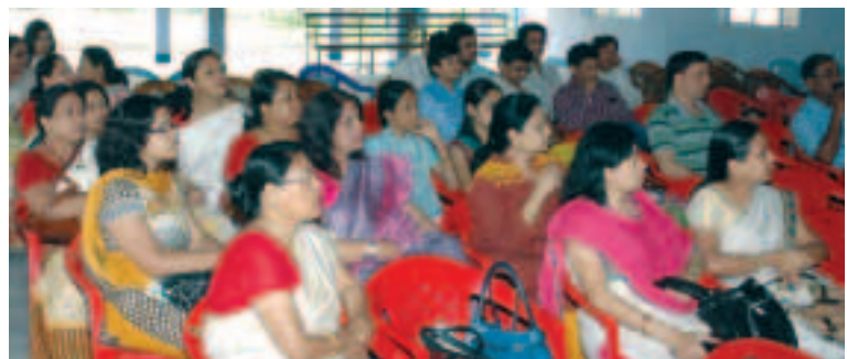
A section of audience