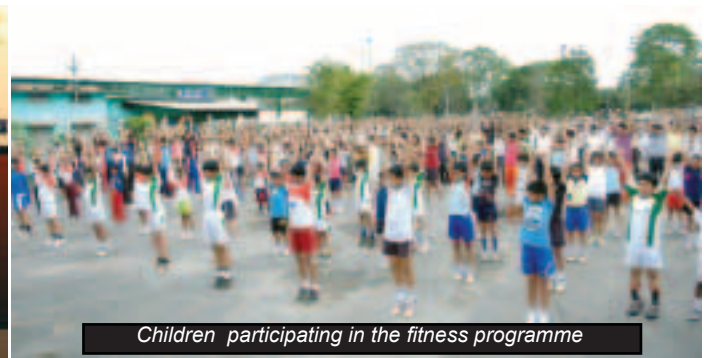
Children participating in the fitness programme