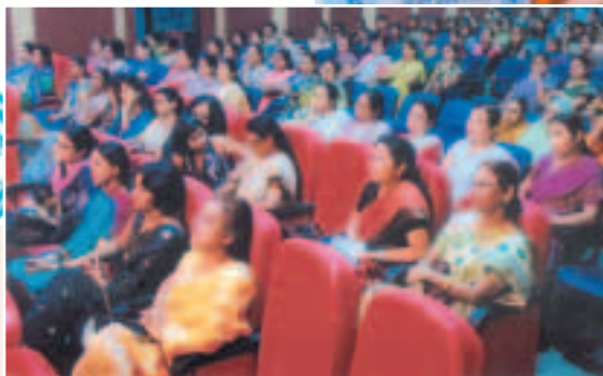
আগ্ৰহী মহিলা শ্ৰোতা / দৰ্শক

আছিল ক্ৰমাগত বৃদ্ধি পাই অহা পানীৰ অভাৱ, পানীৰ অপব্যয়ৰ বিষয় পৰিণতি আৰু পানীৰ যথাযথ ব্যৱহাৰ সম্পৰ্কে জনসাধাৰণক সজাগ কৰি তোলা। প্ৰাকৃতিক আৰু শক্তি সম্পদৰ সংৰক্ষণ তথা পৰিবেশক সুৰক্ষা প্ৰদানৰ দিশত অইল ইণ্ডিয়া লিমিটেডৰ প্ৰচেষ্টা সৰ্বজনবিদিত আৰু এনেধৰণৰ প্ৰচেষ্টাৰ কাৰণে কোম্পানীটোৱে ৰাষ্ট্ৰীয় - আন্তঃৰাষ্ট্ৰীয় স্তৰত বহুতো সন্মান আৰু স্বীকৃতি লাভ কৰি আহিছে।