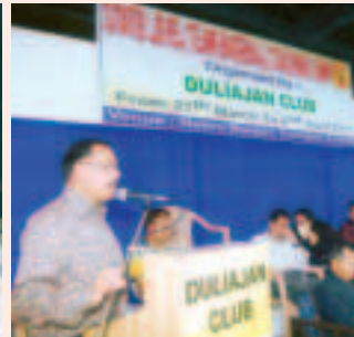
বেচবল প্ৰশিক্ষণ শিবিৰৰ আৰম্ভণি

২০ মাৰ্চ, ২০১১ - PSPBফুটবল টুৰ্ণামেণ্টৰ আৰম্ভণি অনুষ্ঠানৰ সাংস্কৃতিক কাৰ্যক্ৰমত দুলীয়াজান ক্লাব মিউজিক একাডেমী দলৰ অংশগ্ৰহণ।