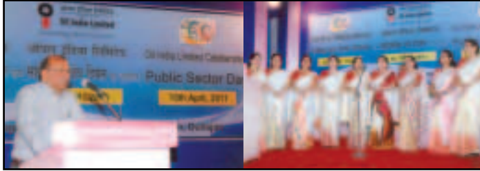
মুখ্য আৱাসিক বিষয়াৰ ভাষণ

Collage) প্ৰস্তুত কৰা প্ৰতিযোগিতা আৰু কুইজ। কাগজৰ কোলাজ প্ৰস্তুতিকৰণ প্ৰতিযোগিতা প্ৰথমবাৰলৈ কোম্পানীত অনুষ্ঠিত কৰা হল যত নিৰ্বাচিত বিষয় আছিল “মোৰ জীৱনত অইল”। অংশ গ্ৰহণকাৰী প্ৰতিযোগীসকলৰ মাজত প্ৰতিযোগিতাটিৰ বিষয়ত যথেষ্ট উৎসাহ দেখিবলৈ পোৱা গৈছিল আৰু তেওঁলোকে নিজ নিজ ধাৰণাক কটা - চিঙা কৰা কাগজৰ মাধ্যমত প্ৰকাশ কৰিবলৈ আন্তৰিকতাৰে চেষ্টা কৰিছিল।