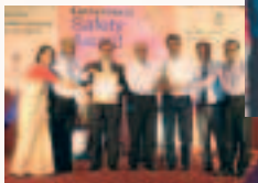
Page - 4