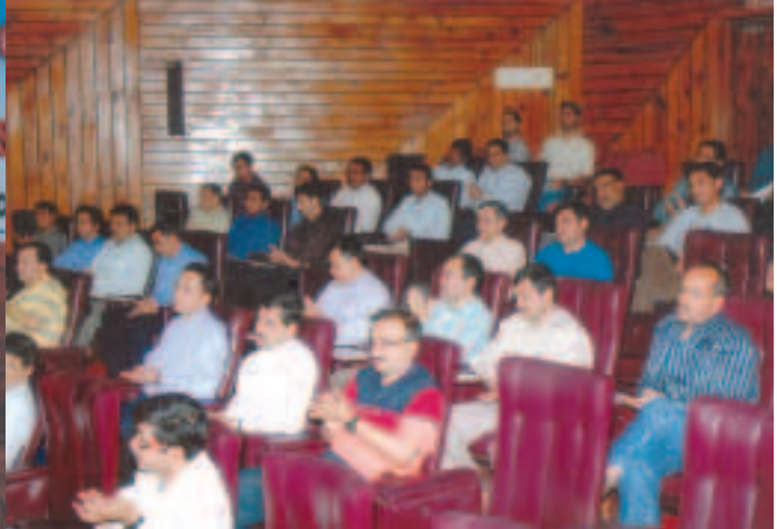
Two days HSE training programme was held in MTDC on 15th & 16th March 2011 for Installation Managers, Mine Safety Officers, Department Safety Officers and Other Mine Officials Drilling, Production Oil, Production Gas, Pipe Line, Rajasthan Project etc.