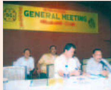
দুলীয়াজান ক্লাবৰ বাৰ্ষিক সাধাৰণ সভা