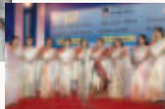
Page - 11