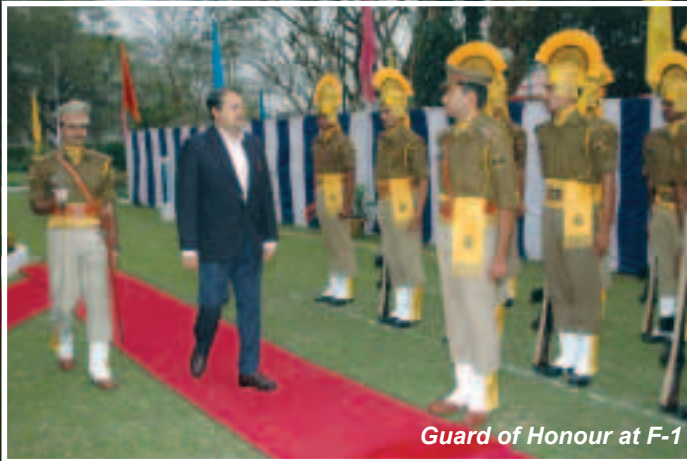
Guard of Honour at F-1